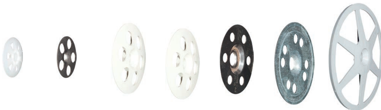
HV 36 plastic