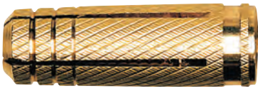
Mocowanie mosiężne MS