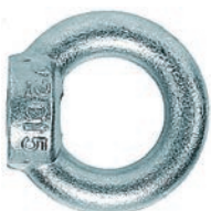
Nakrętka oczkowa RI